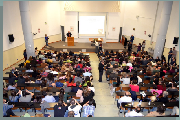
Σχολή Επιστημών Υγείας Πανεπιστημίου Κρήτης- Τμήμα Ιατρικής